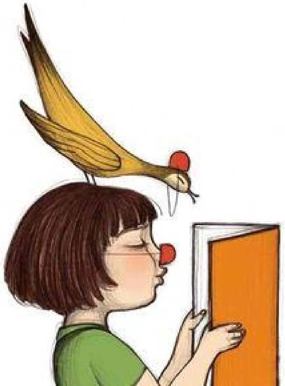
Ilustración de Noemí Villamuza

23 de abril a partir de las 18:30 h. BIBLIOTECA GLORIA FUERTES