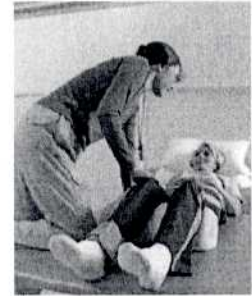
Jornadas de la Ley de Dependencia y empleo